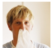
Hilfe für Allergiker