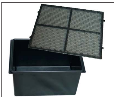
Großer Behälter + Ansaugfilter

der Modelle: CT10+ / CT18+ / CT36+ CT32+ / CT50+