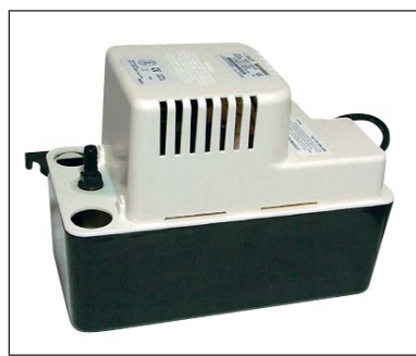
Kondenswasserpumpe KWP externe Ausführung (Quality-Approved mit Sicherheitsmechanismus)