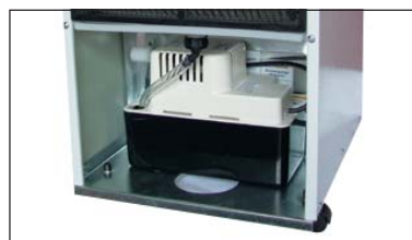
Kondenswasserpumpe KWP im Gerät integriert (Quality-Approved mit Sicherheitsmechanismus)