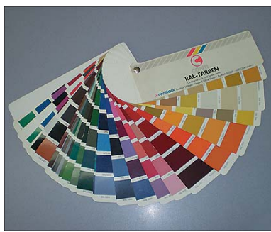
blau gelb rot RAL-Farbe