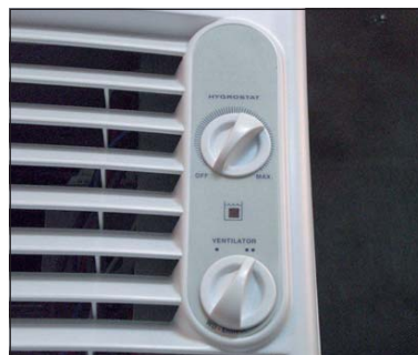
Hygrostat + Ventilatorsteuerung