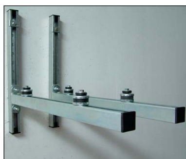
Montagekonsolen zur Wand- montage der Entfeuchter (z.B. in Wäschetrockenräumen); vibrationsgedämpfte Ausführung – Industriequalität