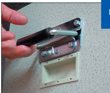
Klapp-Tragegriffe für den Baueinsatz