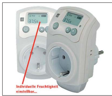
Individuelle Feuchtigkeit einstellbar...